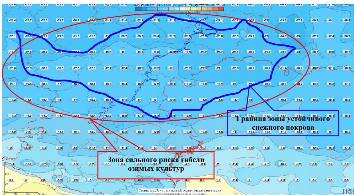
Рис. 1 Распределение минимальных температур на Юге Европейской части России 24.12.2012

Несмотря на прошедшие на Юге России снегопады по состоянию на 24.12.2012 на значительной части Европейской территории России продолжали наблюдаться низкие температуры (Рис. 1) при слабом снежном покрове или его отсутствии (Рис. 2). Минимальная температура в зонах отсутствия снежного покрова опускается ниже -15^{\circ}\text{C} . Сложившаяся ситуация создает высокие риски существенных повреждений и гибели озимых культур на территории Волгоградской, Саратовской, Самарской, Воронежской, Ульяновской и Пензенской областях в зонах отсутствия устойчивого снежного покрова.